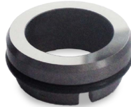
Estacionaria G9 para medidas en milímetros. INCLUIDA