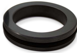
Estacionaria O.M. para medidas en pulgadas INCLUIDA