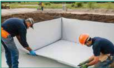
Liner listo para ser instalado