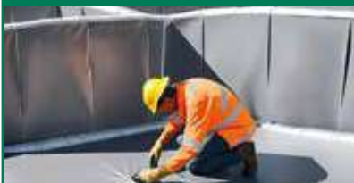
Área de contención secundaria