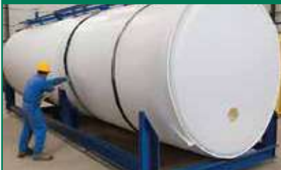
Tanque cilíndrico horizontal